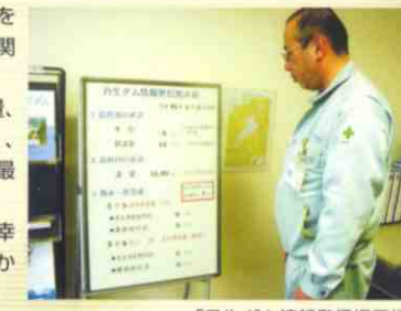
「丹生ダム情報発信掲示板」

水資源開発公社丹生ダム建設所では、「地域に開かれた事務所」を目指す取り組みとして、最新の気象・水象データをとりまとめ、玄関に「丹生ダム情報発信掲示板」を設置しました。 「丹生ダム情報発信掲示板」には、高時川(余呉町管営地区)の流量、降水量(余呉町管営地区・坂口地区)、積雪深(余呉町管見地区)、琵琶湖からの放流量、琵琶湖の水位を掲示しており、毎朝9時に最新情報に更新しています。 是非一度、丹生ダム建設所に立ち寄って、利用していただくと幸いです。今後とも皆様のご意見を伺いながら、さらに「地域に開かれた事務所」の取り組みを進めていきたいと思っております。