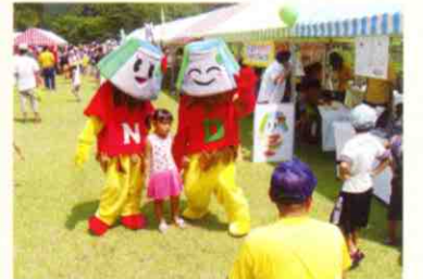
▲みんなと一緒に過ごせて、とても楽しかったヨ (by ダムダムくん、ニューちゃん)