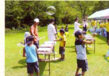
▲最近シャボン玉も大きくなりました