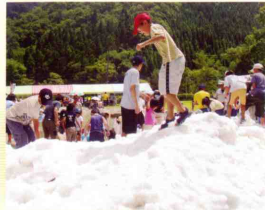
▲真夏に雪がやって来た

去る8月8日、余呉町の「ウッディバル余呉」において「丹生ダムふれあいフェスタ2004」が開催され、約1,500人の来場者で賑わいました。