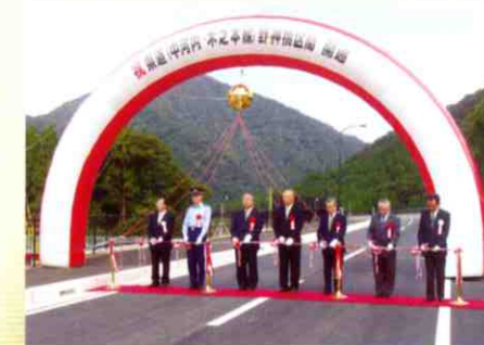
開通式(平成16年9月26日)

現在丹生ダム建設所では、ダム本体工事の準備工事として、道幅が狭い現道の拡幅工事や新設道路の工事を実施しております。この度、道路工事の一部である「県道中河内木之本線及び県道杉本余呉線」の上丹生区間449mが完了し、平成16年9月26日に「開通式」を行い、周辺住民の皆様をはじめ一般の皆様にご利用いただけることとなりました。