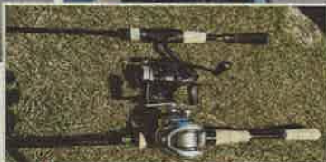
スピニングリール④とベイトリール