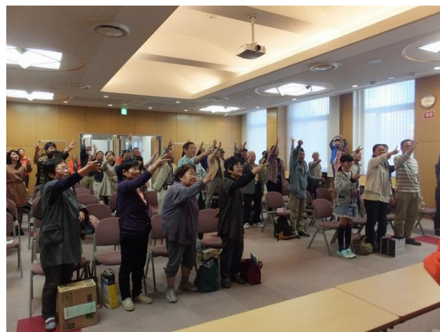
榊原温泉宿泊券争奪じゃんけん大会