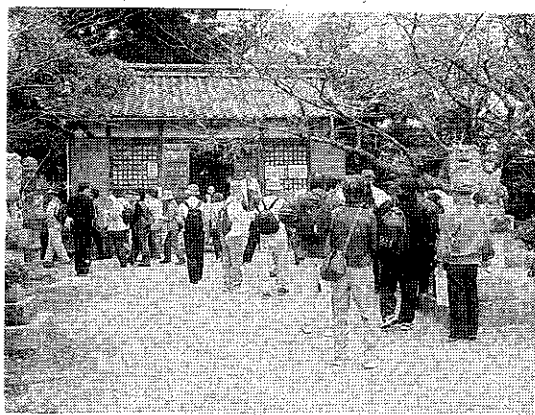
士清ウォーク 谷川神社でのガイド