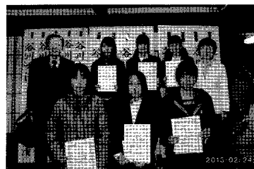
中学生入賞者（出席者）