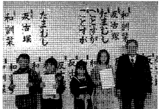
稲垣先生と小学生の特選者