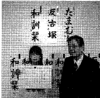
小学生の部 津市教育長賞