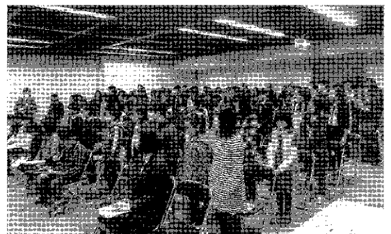
小学生入選者は起立