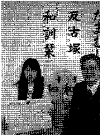
小学生の部 津市長賞

よく練習してその成果が出ていると思われる作品の中で、どこかで差を付けなければと思った時、①気がまえ（目標）をもって書いている。②名前の位置・大きさまでしっかり書けている。③しっかりした線が出ている。文字の配置もよかった。そういう作品を大賞など3賞とし、それに次ぐのを特選としました。名前も作品の一部であることを忘れないように、また集中して目的をもって書いているかということも大切。それに何度も練習して書き続けることが大事ですね。全体としてはしっかり書いてある作品が多くて、よかったと思います。これからもがんばりましょう。」