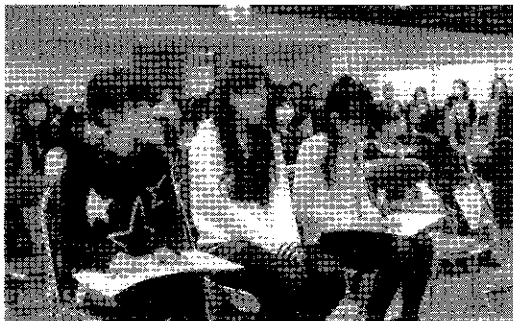
中学生の部 3賞の皆さん