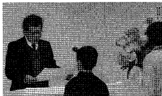
市長賞・教育長賞は石川教育長より